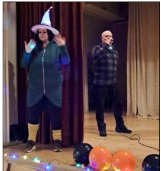
Oik: Paikalla olijat saivat kokea kappaaleen tulkintaa myös viittomakielellä.