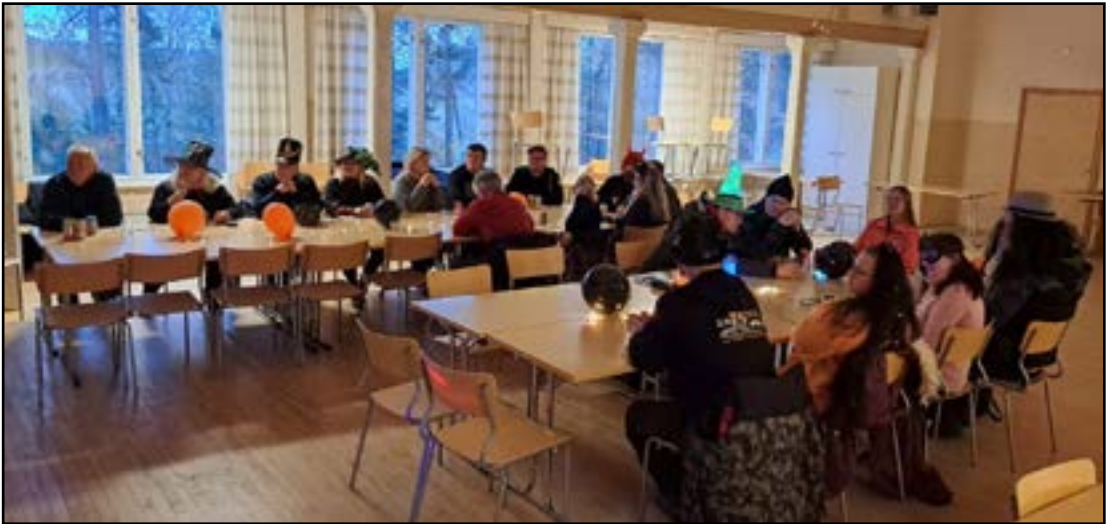
Arpajaisten alkamisen odottelua.