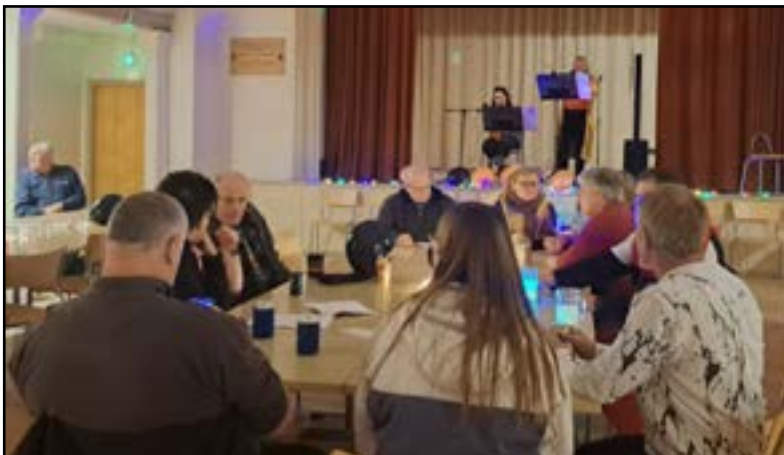
Vas: Yleisöä kuuntele- massa ja selaamassa valittavia kappaaleita.