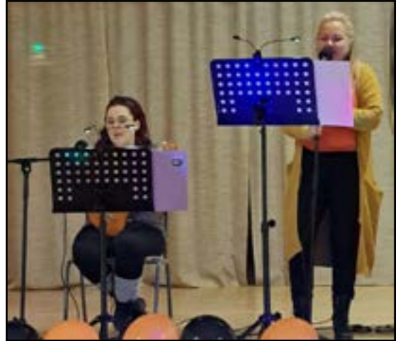
Yllä: Duo TV esiintyy.

Perjantaina saunottiin ensin itsemme puhtoisiksi ja sitten illalla tanssahdettiin Maamiesseuran talolla Duo TV:n johdolla. Duo TV todellakin osoittautui eläväksi jukeboxiksi; kun valitsi piiiitkältä listalta kappaaleen numeron, niin nämä kaksi taitavaa leidiä esittivät sen tuotapikaa.